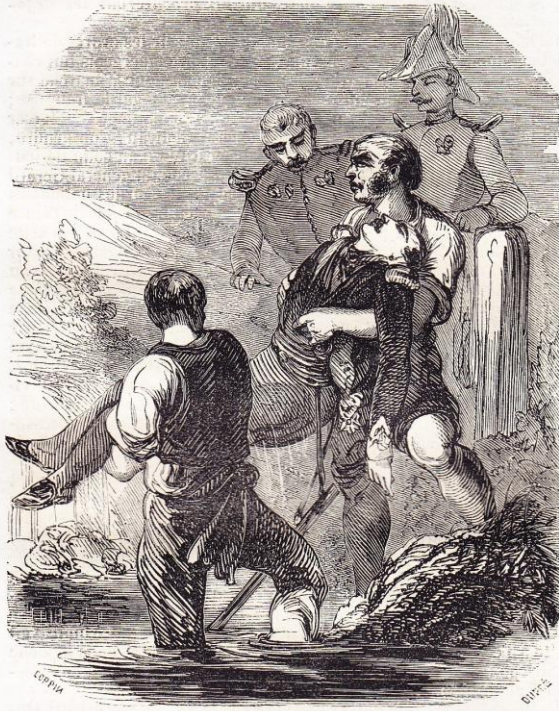
Mort de Poniatowski. Page 152.

Le 9 et le 10 l'Empereur essaie en vain de s'emparer de Laon,